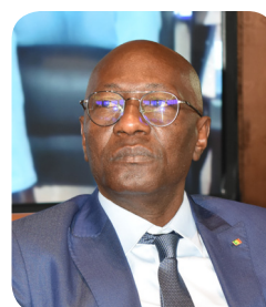
M. Abdoulaye Diop, Ministre de la culture et de la communication.

La Chine et l'Ethiopie sont les invités d'honneur de cette 14 e édition. La grande exposition internationale prévue à l'ancien Palais de justice au Cap Manuel sera composée de 64 artistes et collectifs d'artistes représentant 32 nationalités, d'Afrique, d'Europe, des Etats-Unis, d'Amérique latine et des Caraïbes.